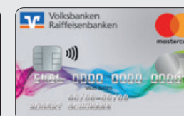
Farbenspiel (Designcode 41)