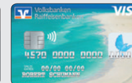
Sandstrand (Designcode 40)